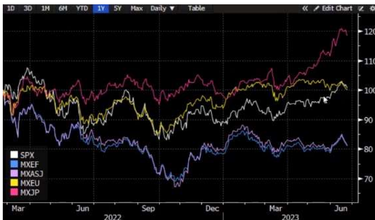
Gibanje delniških indeksov S&P500 (bela), razvijajoči trgi (modra), Azija brez Japonske (vijolična), MSCI Evropa (rumeno) in MSCI Japonska (roza)

Rast delniških trgov, ki traja že od začetka leta, se je tako nadaljevala tudi v zadnjih dveh mesecih, pri čemer so se najbolj odrezali razviti trgi. Iz spodnjega grafa je razvidno, da je najvišjo rast dosegla Japonska, kjer se je indeks Nikkei povzpел najvišje v zadnjih 33 letih. Sledita ZDA in Evropa, medtem pa so ostali globalni razvijajoči trgi in Azija bolj ali manj nespremenjeni.