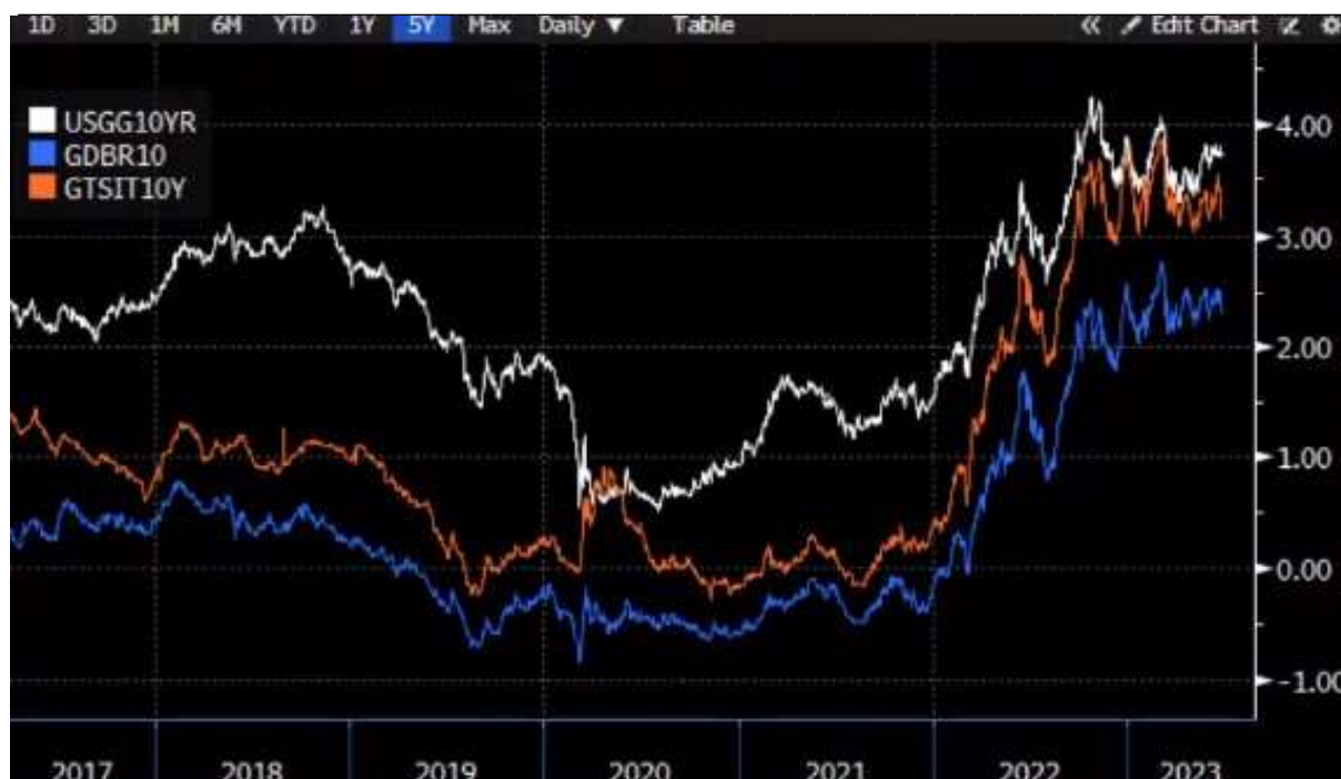
Gibanje donosnosti 10 letnih obveznic ZDA (belo), Slovenije (rdeče) in Nemčije (modro)