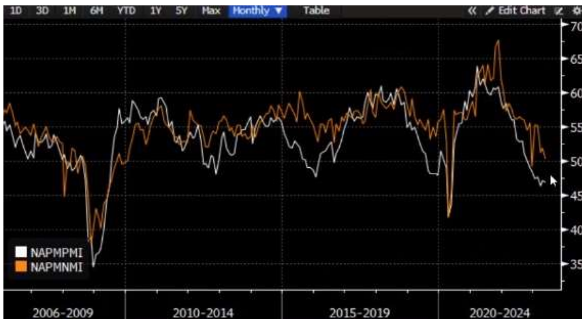
Indeks nabavnih menedžerjev v ZDA za proizvodni (bela) in storitveni sektor (rdeče)

Se pa slabša pričakovanja glede gospodarstva že kažejo na proizvodnem indeksu nabavnih menedžerjev ( PMI ). V ZDA se je ta indeks v juniju znižal že drugi mesec zapored in pristal pri vrednosti 46,3, pri čemer vrednost pod 50 nakazuje na krčenje proizvodnega sektorja, vrednost nad 50 pa na širjenje. Rast v storitvenem sektorju zaenkrat še ostaja saj je PMI v storitvenem sektorju zaenkrat še nad mejo 50. Gibanje obeh je razvidno iz spodnjega grafa.