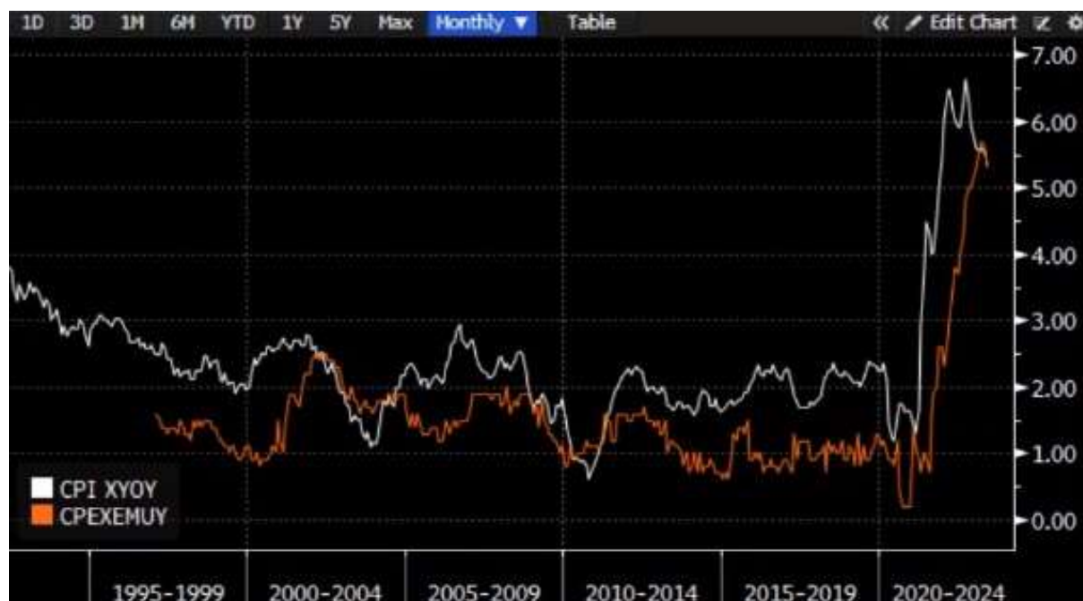
Gibanje jedrne inflacije v ZDA (belo) in EMU (rdeče) na daljši rok

Kljub temu, da se splošne stopnje inflacije na letni ravni znižujejo, je iz spodnjega grafa razvidno, da jedrna inflacija, ki ne upošteva cen hrane in energije, tako v ZDA kot tudi v Evropi upada počasneje.